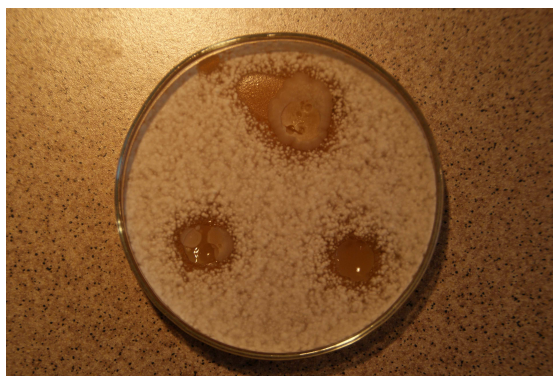
Aktywność fungicydalna szczepu L.plantarum JV wobec Penicillium sp.