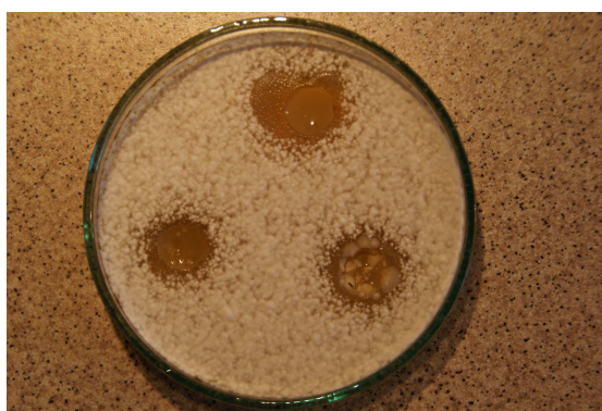
Aktywność fungicydalna szczepu L.plantarum JV wobec Fusarium sp.