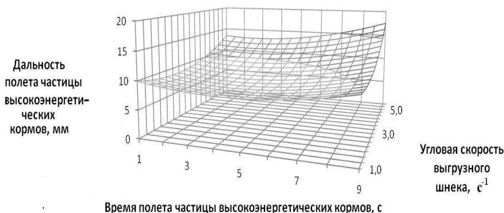
Рисунок 2. Зависимость дальности полёта частицы высокоэнергетических кормов от времени полёта и угловой скорости шнека

Из формулы следует, что в воздухе дальность полёта частицы многокомпонентной высокоэнергетической добавки зависит от физико-механических свойств кормов, угловой скорости шнека и времени полёта частицы корма. На основании полученного уравнения получена зависимость дальности полёта частицы высокоэнергетических кормов от времени её полёта и угловой скорости выгрузного шнека (рисунок 2).